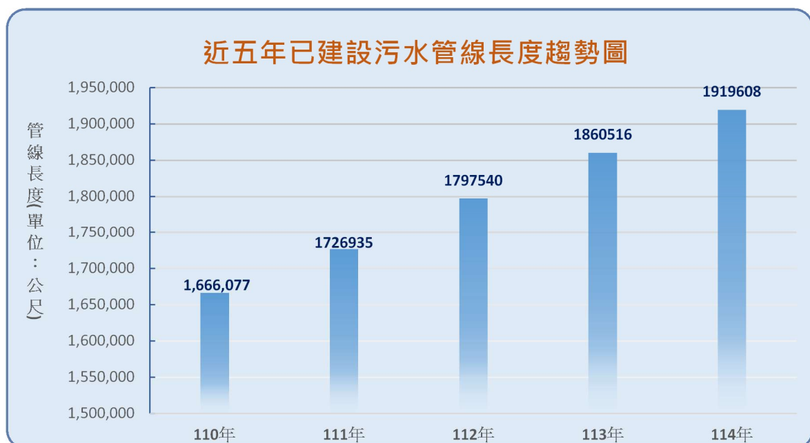
圖 1：近五年污水管線長度趨勢

本市已建設污水管線累計至 114 年 12 月底已達 191 萬 9,608 公尺，當年度增加 5 萬 9,092 公尺，統計近五年污水管線建設長度平均每年以 5~7 萬公尺穩定增加(如圖 1)。本市公共污水下水道用戶接管普及率累計達 51.09% ，當年度增加 0.16% ，每年持續穩定成長。此外，污水處理設施部分，本市污水處理廠已建設完成 7 座，分別為中區污水處理廠、楠梓污水處理廠、大樹污水處理廠、旗美污水處理廠、鳳山水資源中心、岡山橋頭污水處理廠以及臨海水資源中心。近 5 年已建設污水管線長度趨勢圖如圖 1。