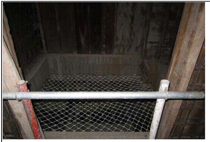
工作台施作前應先設置安全網並評估工作